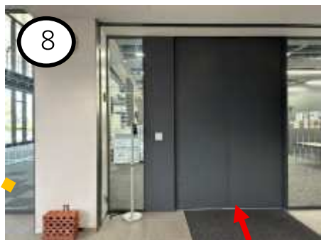
集合場所入口 DX 教育研究センター 1F(オープンスペース)