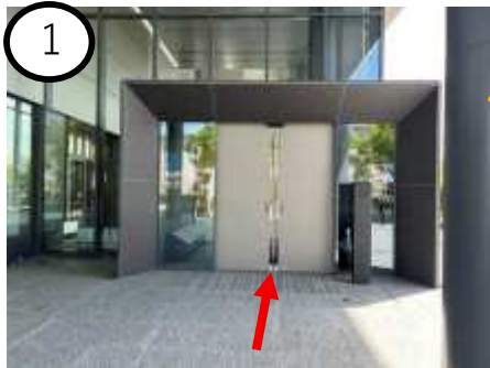
情報工学研究棟入口