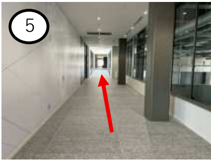
隣の DX 教育研究センターへお進み