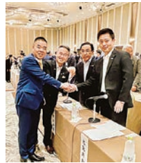
右から吉村大阪府知事、西脇京都府知事、杉本福井県知事、関西広域連合長の三日月滋賀県知事